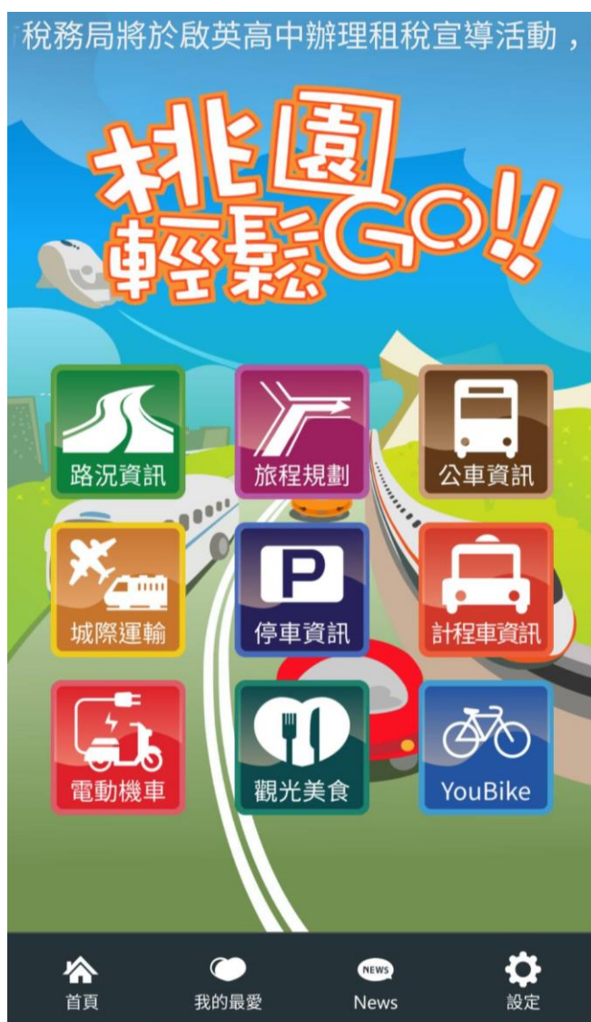
圖 1 「桃園輕鬆 GO」App 系統畫面

本 App 應用程式開發有 iOS 及 Android 兩大作業系統平台的適用版本，主要以 9 大功能為主，包含：路況資訊、旅程規劃、公車資訊、城際運輸、停車資訊、計程車資訊、電動機車、觀光美食及自行車資訊等，本 App 系統畫面及功能架構如圖 1 及圖 2 所示；